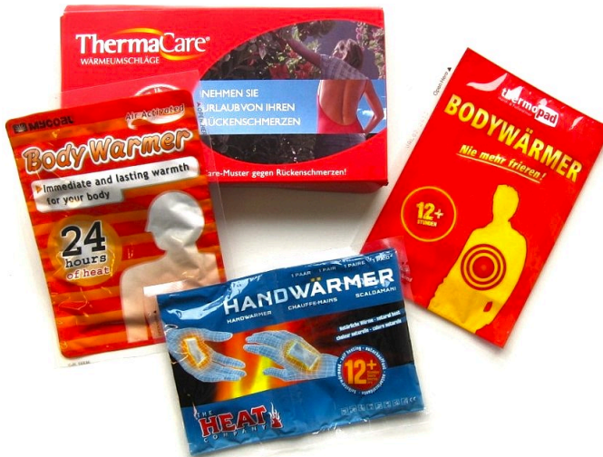
Abb. 1: Verschiedene Handwärmer 1

Heute geht es um einen Handwärmer . Das sind zwei Worte in einem: Hand|Wärmer . Es ist also etwas, was unsere Hand warm macht.