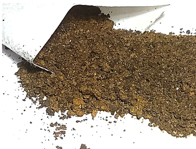
Abb. 4: Handwärmer Beutel 12h offen 3

Das ist nicht ekelig. Das ist Rost. Unter dem Mikroskop \boxtimes kannst du es besser sehen.