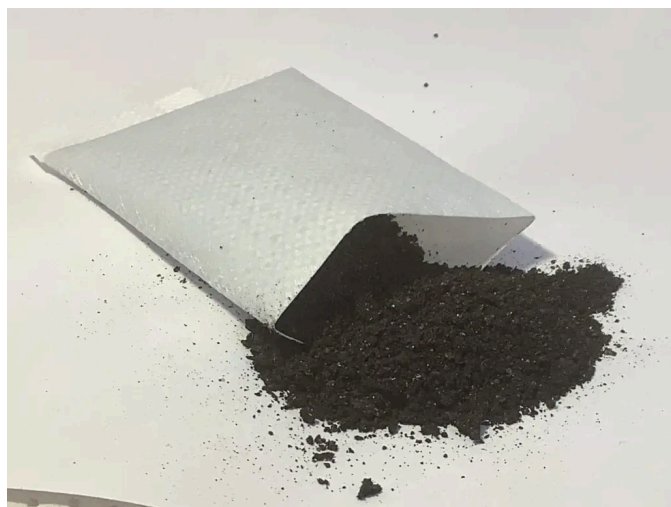
Abb. 2: Handwärmer Beutel offen 3

Wir schneiden den Beutel auf. Was siehst Du?