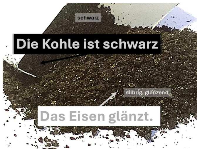
Abb. 3: Kohle und Eisen 3