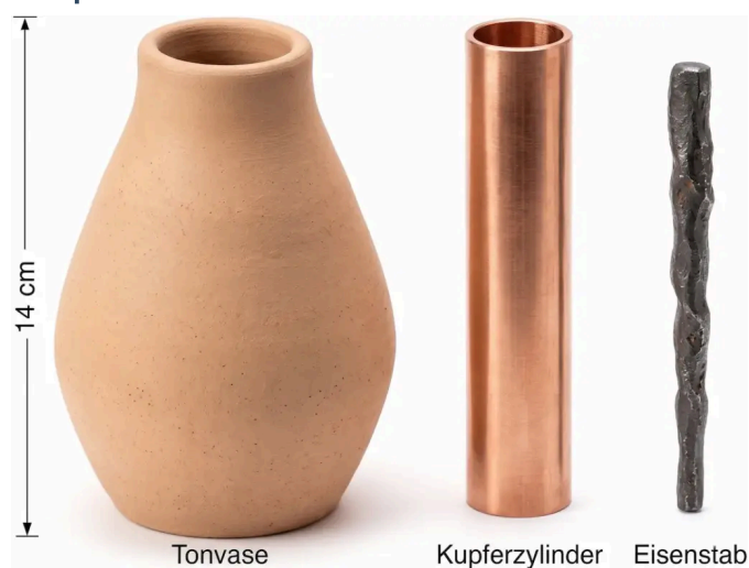
Abb. 1: Komponenten der Bagdad-Batterie (Illustration). 1