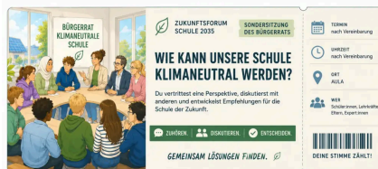
Abb. 2: Dein Ticket.

Klingt gut. Aber wie genau – und wer trägt die Kosten? Im Bürgerrat vertrittst du eine echte Position und musst mit anderen eine Lösung aushandeln, die trägt.