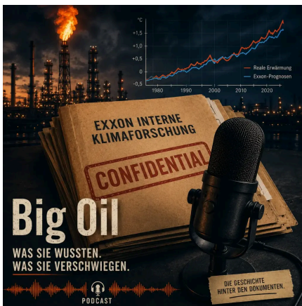
Abb. 1: Die Geschichte dahinter

Große Ölkonzerne wussten seit Jahrzehnten, was ihr Produkt mit dem Klima macht. Und sie nutzen ihr Wissen nicht. Wie funktioniert gezielte Desinformation – und wie erkennst du sie? Mit der PLURV-Methode lernst du, Strategien zu durchschauen, bevor sie dich überzeugen.